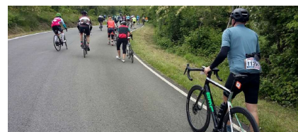
Alcuni a piedi lungo il Barbotto...