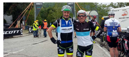
Sulla sommità del Barbotto